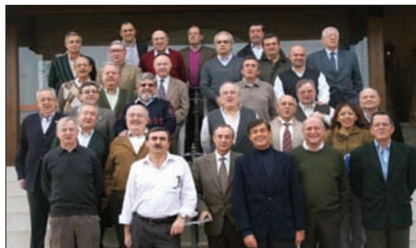
Los Jurados españoles reunidos en Aranda de Duero.