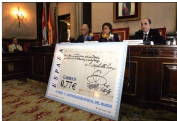
Presentación del sello conmemorativo en el Salón de Plenos del Ayuntamiento de León.