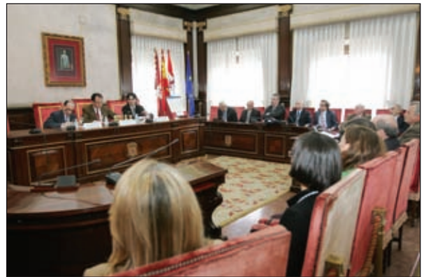
Clausura del ciclo de Conferencias, en el Ayuntamiento de León.