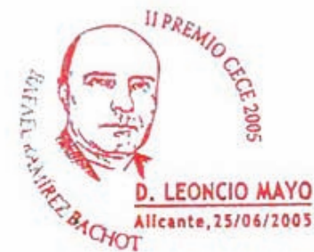
Gomígrafo dedicado al II Premio C.E.C.E.