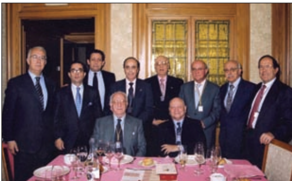
El nuevo Académico Honorario, Antonio Mingote, rodeado por diversos amigos y Académicos.

A lo largo de este año de 2005 los Académicos, a título personal o en nombre de la corporación, tuvieron una serie de intervenciones públicas y recibieron distintas distinciones de las que vamos a hacer referencia breve, porque aunque en su día Academvs dio cuenta de unas y otras, es justo que figuren en esta ordenación, año por año, de nuestra Academia.