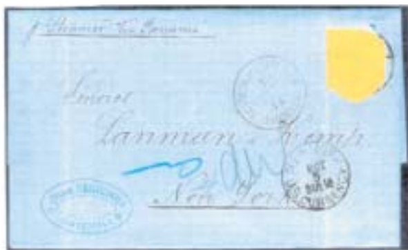
Figura 5: 7 de septiembre de 1874.

Para prevenir falsificaciones –si los sobres despojados de sus sellos de franqueo cayeren en malas manos– Henry Madden publicó en El Quetzal (núm. 223/abril de 1979) bajo el título The Lanman and Kemp Stamp «Less» Covers of Guatemala una relación muy detallada de las 54 cartas inicialmente franqueadas, fechadas entre el 16 de marzo de 1871 y el 15 de octubre de 1878 y dirigidas a Lanman & Kemp en Nueva York que, inicialmente, me sirvió de referencia para estas notas. Para cada carta indica: