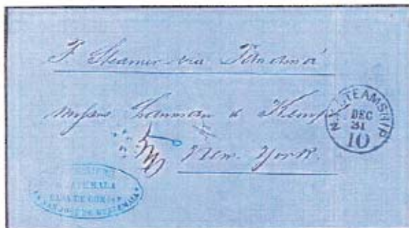
Figura 2: 1867. Sin marca postal de Guatemala.