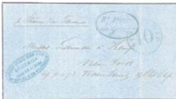
Figura 1: San José de Guatemala, 20 de mayo de 1863.