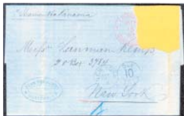
Figura 6: 15 de septiembre de 1878.

La generalización del uso de sobres para la correspondencia comercial fue la razón principal de que tales cartas no se conozcan después de 1880. A partir de esta fecha, solamente fue necesario archivar su contenido. En Guatemala, este cambio fue muy rápido después de 1874, probablemente promovido por la emisión de enteros postales en abril de 1875. Así tenemos: