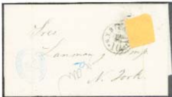
Figura 4: 26 de febrero de 1872.

7) La fecha de recibo manuscrita de Lanman & Kemp . En el 98 por ciento de estas cartas el franqueo fue removido, arrancado, recortado o mutilado de cualquier forma. Para que las mutilaciones aparezcan claramente, una hoja de papel amarillo fue insertada en lugar del franqueo removido (Figs. 4 a 6). Aun en este mal estado, son una valiosa fuente de información sobre los períodos de uso de las marcas postales de aquella época. También ilustran el cambio de valor de los sellos, decretado el 26 de enero de 1872, al agotarse el valor de 1 centavo utilizado para completar portes en reales con sellos en valores decimales.