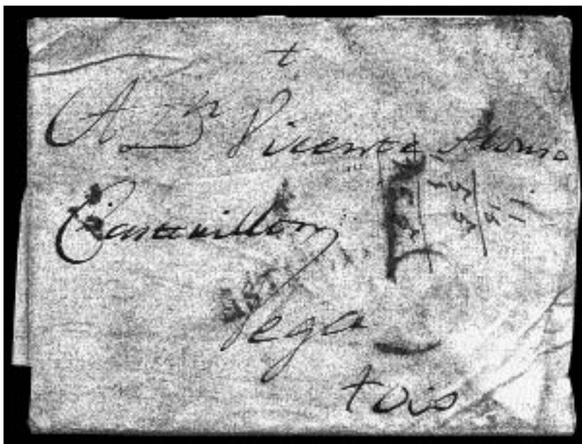
Sobrescrito núm. 2: Circulado el 24-enero-1805 entre Oviedo y Vega (Puerto de), las mismas poblaciones que el sobrescrito núm. 1, aunque con porteo "5" cuartos. Nos hace ver que entre ambas cartas se produjo el aumento de un cuarto en el importe, en este caso para envíos sencillos.

Viene esta anotación metodológica a colación, porque por parte del otro coautor de este artículo (Fernando Alonso García), se observó que al contrastar un número superior a las 50 piezas postales circuladas entre 1803 y 1806 (ver tabla 1), se llegó a la conclusión de que al menos hasta el 19 de octubre de 1804 todos los portes analizados coincidían plenamente con los citados en las tablas del número 2 de "Acadēmv̄s", correspondientes a la tarifa de 1779, aumentando, desde al menos el 24 de enero de 1805, en un cuarto de vellón todas las cartas de la península. Esto llevaba directamente a la conclusión de que el aumento de portes que se había pensado que había ocurrido en 1807, se adelantaba en dos años. Véanse los sobrescritos números 1 y 2 con iguales puntos de origen y de destino (de Oviedo a Puerto de Vega). Mientras el número 1, de fecha 04-07-1804, lleva estampado el porteo de "4" cuartos; el número 2, de fecha 24-01-1805, tiene estampado un porteo de "5" cuartos. Sin embargo, no se tenía conocimiento alguno sobre la existencia de una norma que hubiese producido tal aumento de la tarifa.