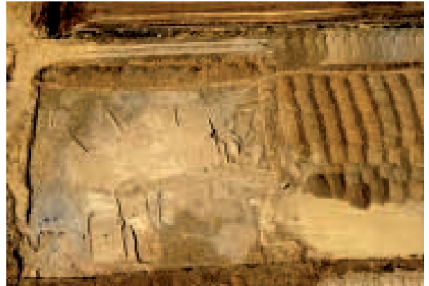
Foto aérea de la mutatio o mansio de Lancia.

Hay que recordar que la arqueología es una fuente histórica independiente de la literaria y tan importante y válida, lo que explica y consolida su ayuda imprescindible para escribir la Historia, como escribió Rostovtzeff.