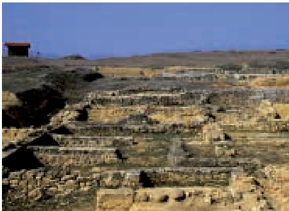
Lancia. El macellum (mercado) y las termas en segundo plano.

Aparece citada en Ptolomeo, en el Itinerario de Antonino, por Plinio el viejo, Floro, Dion Casio y Orosio, lo