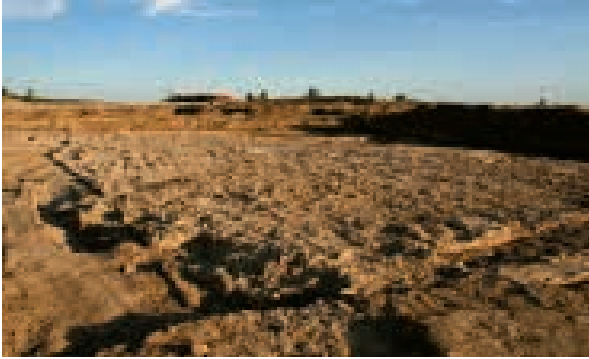
Restos del edificio sobre el terreno tras su excavación en 2010.

El ponente explicó que el referido Edificio de Postas, mutatio o mansio o servicio de postas oficiales, fue construido en el siglo I después de Cristo, quizá en la época del emperador Augusto, aunque es probable que sea algo posterior.