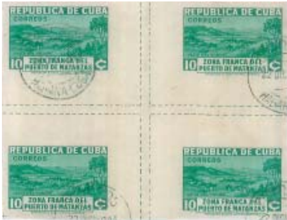
Centro de hoja.

Los sellos de esta emisión fueron impresos en hojas de 100 sellos, las que estaban atravesadas horizontal y verticalmente por una línea blanca del diámetro de los sellos, que las dividía en 4 hojas de 25.