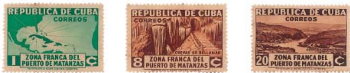
Sellos de la emisión de la Zona Franca de Matanzas.

Negociado de Servicio Internacional y Asuntos Generales. Venta de la emisión de sellos de la Zona Franca del Puerto de Matanzas.