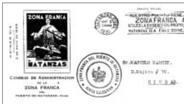
Sobre del primer día de uso del cancelador alegórico a la Zona Franca.

Además, el Consejo de Administración de la Zona Franca envió no sólo a filatelistas, sino a distintas personalidades, tanto nacionales como en el extranjero, una carta donde les comunicaba que se pondría en uso en la Administración Central de Correos de Matanzas un cuño cancelador alegórico a la Zona Franca del Puerto de Matanzas.