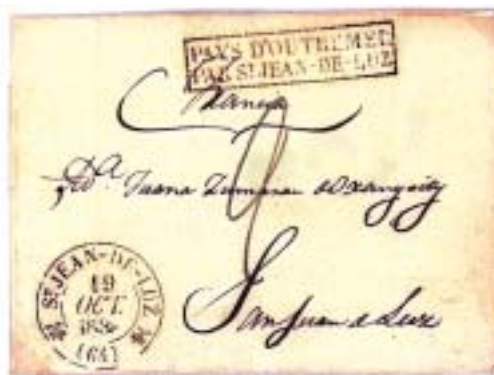
De San Sebastián 18/10/1838 a San Juan de Luz. Sin marca de origen. Marca de entrada en Francia, PAYS D'OUTREMER/PAR ST.JEAN-DE-LUZ. Porteo mns. “2” décimas. En el mismo anverso, llegada ST.JEAN-DE-LUZ(64) 19 OCT 1838.

Sólo he encontrado en 1838-39 la rara marca PAYS D'OUTREMER/PAR ST.JEAN-DE-LUZ 9 en estas cartas: