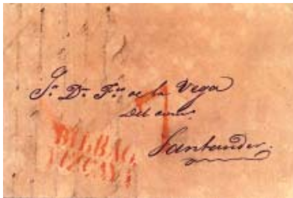
De Bilbao 15/7/1835 a Santander. La misma marca BILBAO/VIZCAYA y observamos que el porte sencillo que venía siendo de 6 cuartos sube a "7". En el texto: "...Vivimos aislados. Las trincheras que nos rodean se ponen con actividad. Municiones, víveres y demás, hay en abundancia..."