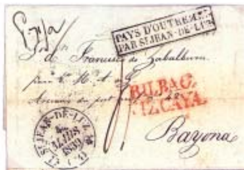
De Bilbao 1/3/1839 a Bayona. Marca de origen BILBAO/VIZCAYA roja. Entrada en Francia, PAYS D'OUTREMER/PAR ST.JEAN-DE-LUZ negra. Porte mns “4”. Señala 7 1/2 gr. En el mismo anverso, fechador ST.JEAN-DE-LUZ 4 MARS. Al dorso, BAYONNE 4 MARS 1839. Del texto: “...pero como los temporales de mar continuaron por muchos días ha sido difícil que éste ni otro alguno se atrevieran a salir de barra, y han estado condenados hasta que lo pudiesen hacer sin riesgo” y “...Estarán Vds. mejor que nosotros al corriente de lo que pasa en el campo faccioso; puede ser este un principio para que terminen los males de una guerra civil tan cruel. Quiera Dios que veamos mejores días que los que hemos experimentado en estos cinco años...” 10