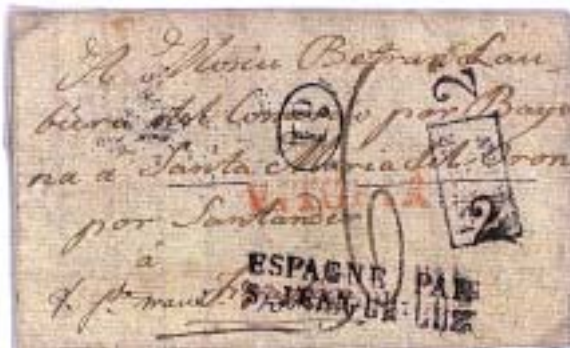
De Vitoria 18/12/38 “por Santander y Bayona” a Oloron. Marca VITORIA roja. Ofrece esta carta la singularidad de llevar dos marcas de entrada en Francia, ESPAGNE PAR/ST.JEAN-DE-LUZ y ESPAGNE/PAR/OLORON-2. Portes franceses “2” hasta S-J-de Luz y “6” hasta Oloron, “1D” décima rural y al dorso, “8” cuartos español de Vitoria a la frontera. Fechadores BAYONNE 27 DEC 38 y OLORON 6 JANV 1839 (tardanza incomprensible de 10 días entre Bayona y Oloron).

Y recojo dos cartas de mismos remitente y destinatario, repitiendo la 2. a el texto por si no había llegado la 1. a , de Vitoria a Oloron, en 1838 “por Santander” y en 1839 “por Zaragoza”.