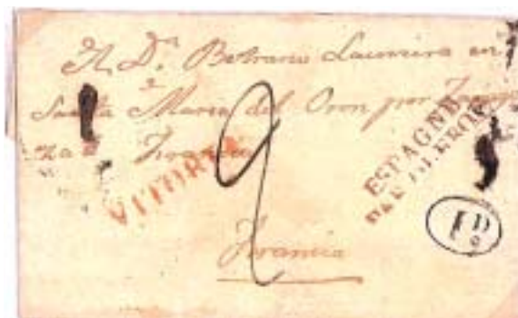
De Vitoria 17/1/1839 “por Zaragoza” a Oloron. Marca VITORIA roja. Portes “2” y “1D” franceses. Al dorso, “8” español y fechadores franceses ESPAGNE/1-OLORON-1 22 JANV. y OLORON 23 JANV 1839. El mismo texto repetido, de la anterior. Entresaco: “...no suplico más que por él, pues hace un año que está preso en Sevilla, lo tomaron por opinión de carlista siendo mentira como los papeles de aquí lo han acreditado, pero en todas las cosas el dinero es lo que ayuda y ese le falta, pues está pasando muchos trabajos...”