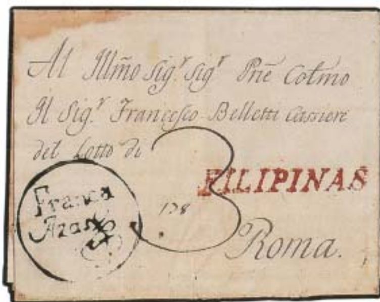
1787. Manila a Roma, via México. Marca lineal "Filipinas" en rojo y marca "Franca/Azas" circular en negro.