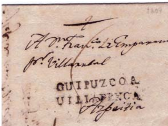
Fig. 9. Marca GUIPUZCOA/UILLAFRNCIA de Lazcano 18/8/1809 a Azpeitia, con porte manuscrito, 5 ctos.