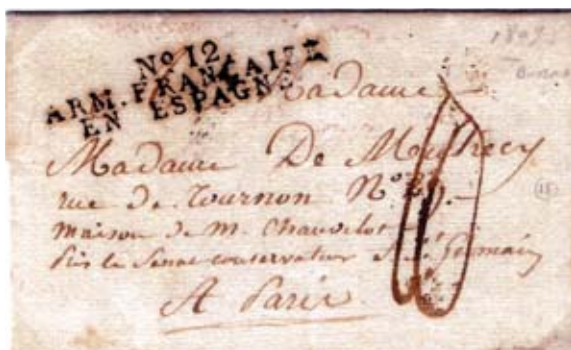
Fig. 2. Carta de Bilbao 6/11/1809 dirigida a París, con marca N° 12/ARM.FRANÇAISE / EN ESPAGNE y porte francés de 10 décimas de franco.

Thouvenot, anterior Jefe militar de Guipúzcoa, “actuó de hecho como un auténtico virrey y se destacó por haber logrado montar una administración ágil, aunque para ello hubiese de dismantelar las instituciones forales (...) Asumió la supresión de las Diputaciones, lo que suponía de facto la abolición del régimen foral (...) En su lugar creó un Consejo de Gobierno con sede en San Sebastián, su lugar de residencia, formado por el propio Thouvenot y tres consejeros, uno por cada Diputación” 11 .