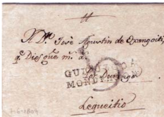
Fig. 6. Marca GUIPUZCOA/MONDRAGON en carta de Aránzazu 7/6/1809 (1ª fecha que conozco de estas marcas “francesas”) dirigida a Lequeitio y 5 negro de porteo marcado en Mondragón.