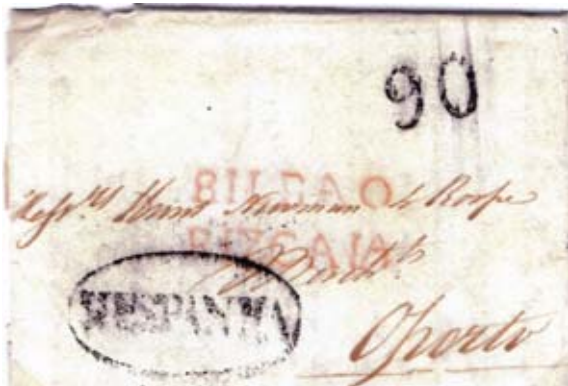
Fig. 14. Marca roja BILBAO/BIZCAIA en carta de 22/7/1814 a Oporto. Marcas portuguesas, de entrada HESPAÑA y de porteo 90 reis. Escrita en inglés por un oficial de Wellington.