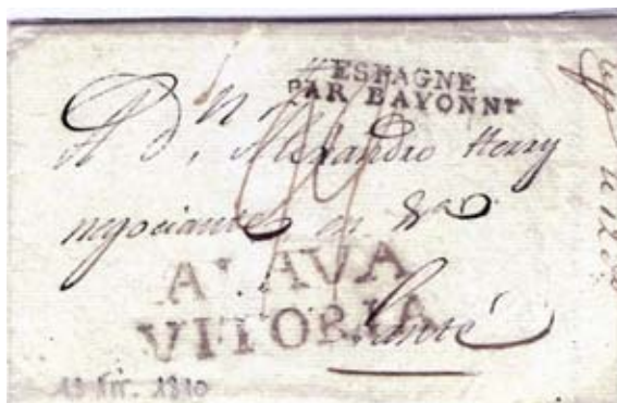
Fig. 4. Marca ALAVA/VITORIA en carta de Vitoria 18/11/1810 a Gante (entonces en poder de Francia). Marca de entrada ESPAGNE/PAR BAYONNE. Porte manuscrito de 19 décimas.

Incluyo cartas con las marcas prefilatélicas de origen del período francés , así como algunas muestras del correo militar de los invasores en estos territorios.