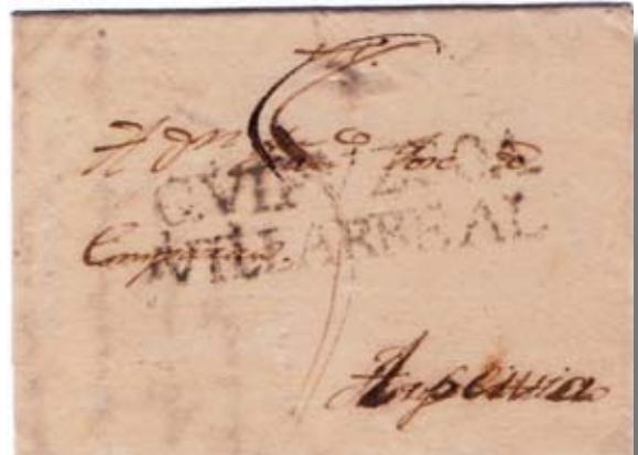
Fig. 10. Marca GUIPUZCOA/VILLARREAL (65 mm) de Legazpia 29/9/1811 a Azpeitia. Porte manuscrito 5 c.