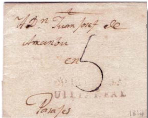
Fig. 11. Marca GUIPUZCOA/UILLA REAL (51 mm) de Segura 16/10/14 a Pasajes. Porte 5 negro de SS.