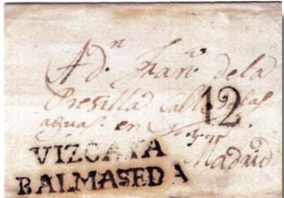
Fig. 15. Marca VIZCAYA / BALMASEDA en frente de carta dirigido a Madrid. Porte 12 cuartos.