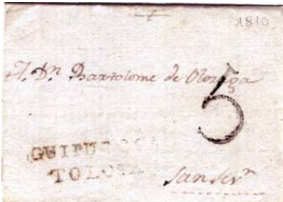
Fig. 8. Marca GUIPUZCOA/TOLOSA en carta de 29/7/1810 a San Sebastián con porteo 5 negro de SS.