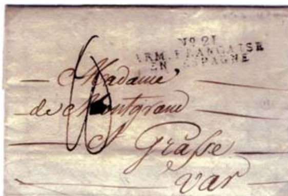
Fig. 3. Carta fechada “auprès de Vitoria” el 19/4/1810 dirigida a Grasse, departamento de Var, con marca N° 21/ARM-FRANÇAISE / EN ESPAGNE y porte de 10 décimas.

El correo militar francés en la Península funcionó independiente y paralelamente al de las postas españolas y usaba marcas propias en su correspondencia, con la nomenclatura común ARM.FRANÇAISE/EN ESPAGNE, precedida de un número. En Vizcaya fue el conocido N° 12; en Guipúzcoa, el 14 y en Álava, el 21 12 .