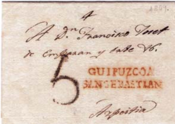
Fig. 7. Marca roja GUIPUZCOA/SAN SEBASTIAN 21/8/1809 a Azpeitia, con marca de porte sencillo 5 negro de San Sebastián.