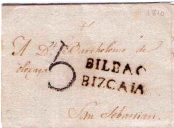
Fig. 13. Marca negra BILBAO/BIZCAIA en carta de 19/7/1810 a SS. Porteo sencillo, 5 negro de SS.