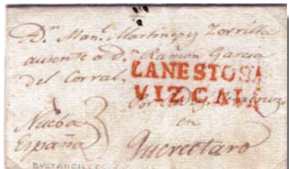
Fig. 17. Marca roja VIZCAYA/LANESTOSA en carta de Bustancilles, Cantabria a Querétaro, Nueva España, sin señal de porteo.