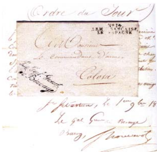
Fig. 1. Oficio dirigido al Comandante de armas de Tolosa, con marca negra de los ejércitos franceses N° 14/ARM.FRANÇAISE / EN ESPAGNE y otra de franquicia LE GENL.GOUV. / DE BIZCAYE, con la firma autógrafa del general Thouvenot, reclamando contribuciones atrasadas de ayuntamientos y particulares y urgiendo la ejecución de morosos. Fechado en San Sebastián el 1 de noviembre de 1810.

Thouvenot, anterior Jefe militar de Guipúzcoa, “actuó de hecho como un auténtico virrey y se destacó por haber logrado montar una administración ágil, aunque para ello hubiese de dismantelar las instituciones forales (...) Asumió la supresión de las Diputaciones, lo que suponía de facto la abolición del régimen foral (...) En su lugar creó un Consejo de Gobierno con sede en San Sebastián, su lugar de residencia, formado por el propio Thouvenot y tres consejeros, uno por cada Diputación” 11 .