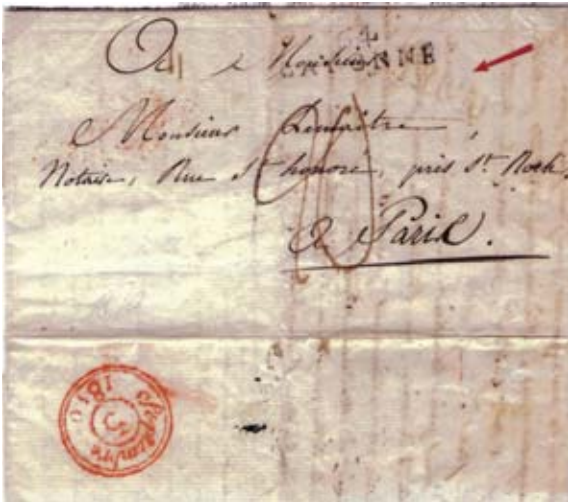
Fig. 12. Marca rojo-amarillento YRUN en carta de Vitoria 25/8/1810 a París que lleva como marca de entrada en Francia (equivocada) la departamental 64/BAYONNE y porte manuscrito 20 décimas. Al dorso, fechador rojo de llegada a París, Septiembre/5/1810.