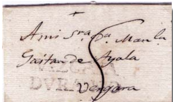
Fig. 16. Marca negra VIZCAYA/DVRANGO en carta de Marquina 24/5/1810 a Vergara. Manuscrito, 5 cuartos de porteo sencillo.