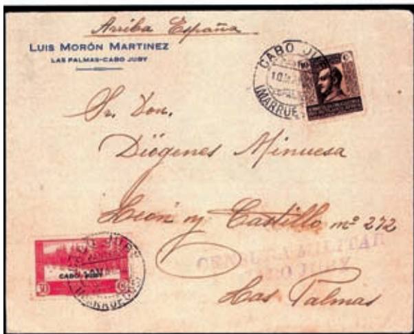
Sobre circulado el 10 de mayo de 1938 de Cabo Juby a Las Palmas, que lleva adherido un sello benéfico Pro Mutilados. Única pieza conocida.

Los sellos Pro Mutilados, no obstante, nunca son objeto de esta habilitación, como tampoco lo fueron años más tarde los denominados Pro Tuberculosos, por lo que es evidente que jamás debían tener uso en Cabo Juby.