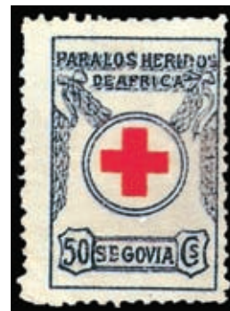
Viñeta de 50 cts. de la Cruz Roja de Segovia, con la leyenda "Para los heridos de Africa". No lleva ninguna indicación de fecha.