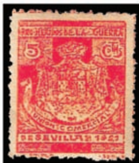
Viñeta de 5 céntimos de la Union Comercial de Sevilla de color rojo y la leyenda "Pro heridos de la guerra". Es del año 1921 por lo que, lógicamente se refiere a los heridos de las guerras de Marruecos.

Como consecuencia de todo lo anterior, se produjeron muchas muertes, heridos, mutilados e inválidos entre las tropas españolas, lo que dio lugar a movimientos de ayuda a las víctimas, utilizando diversos métodos. Uno de ellos fue la creación de unas viñetas de uso voluntario, de las que conocemos dos: