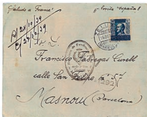
Carta procedente de Zeluán con el sello del Regimiento de Fortificaciones nº 5, sin franqueo, por gozar de franquicia, pero a la que se le adhirió el sello Pro Mutilados.

La franquicia postal fue objeto, a lo largo de los años, de múltiples disposiciones regulando la misma para evitar abusos. La última de ellas fue el Real Decreto de 23 de septiembre de 1908, que estableció los requisitos formales que debía tener el sobre. Con independencia de ello, las tropas destinadas a Marruecos gozaban de franquicia.