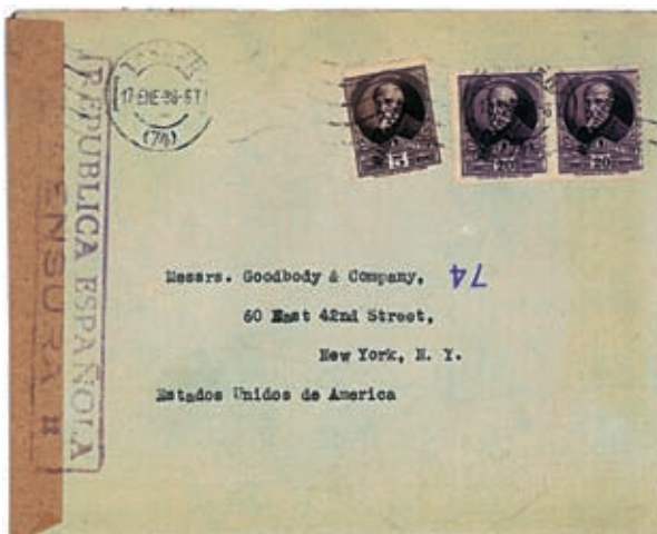
Antes de la incorporación de Tánger a la zona de nuestro protectorado en Marruecos, los sobres circulaban sin necesidad del sello Pro Mutilados, como lo evidencia este sobre de fecha 17 de enero de 1938.

Art. 4.º Por el Ministerio de Asuntos Exteriores se dictarán las disposiciones necesarias para la ejecución de las que anteceden y, señaladamente, las normas de Derecho transitorio que fueran precisas.