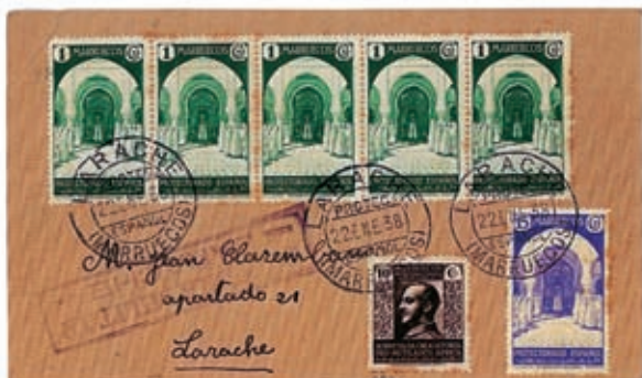
Carta del correo interior de Larache, con el franqueo correspondiente de 20 cts., pero a la que se le impuso un sello de sobretasa indebidamente.

a) cartas para el correo interior de las poblaciones. Éste era de 20 céntimos y en varias ocasiones se aplicó el sello Pro Mutilados.