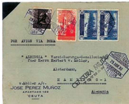
Carta de Tetuán a Hamburgo, de fecha 29 de abril de 1938, en que además del franqueo correspondiente (50 c + 80 cts.) lleva adherido indebidamente el sello de sobretasa.

La franquicia postal fue objeto, a lo largo de los años, de múltiples disposiciones regulando la misma para evitar abusos. La última de ellas fue el Real Decreto de 23 de septiembre de 1908, que estableció los requisitos formales que debía tener el sobre. Con independencia de ello, las tropas destinadas a Marruecos gozaban de franquicia.