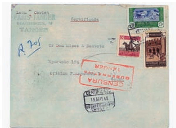
Pero, anexionado ya a Marruecos se hace obligatorio adherir a la correspondencia el sello Pro Mutilados.

Franco, con esta "ocupación" de Tánger, manifestaba al pueblo español su voluntad de "Imperio", pero cometió dos grandes errores: