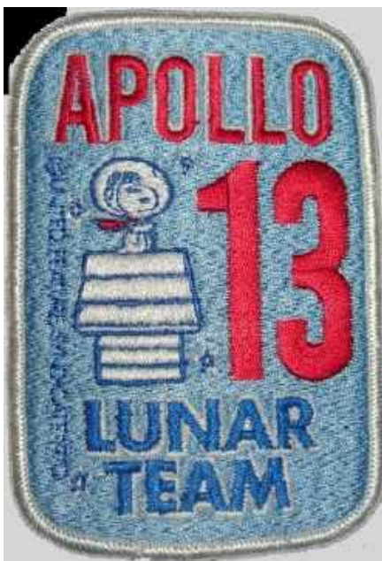
◀ Foto 4. Emblema identificativo del equipo del Apollo XIII al que perteneció José M. Grandela.